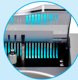
Lampe germicide UV

Grâce au diagnostic automatique à 9 niveaux, l'opérateur peut examiner les principaux composants et s'assurer du bon fonctionnement de la machine.